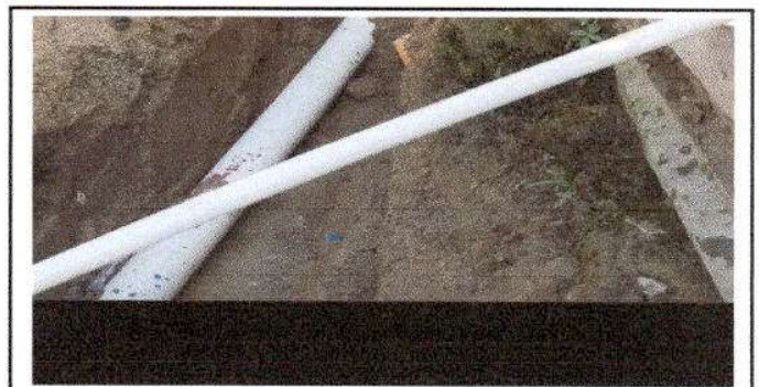
Foto 6: Sustitución de tubería pvc Linea principal de agua negras

Observación: Si es necesario se pueden agregar hojas adicionales y actualizar el número de hojas.